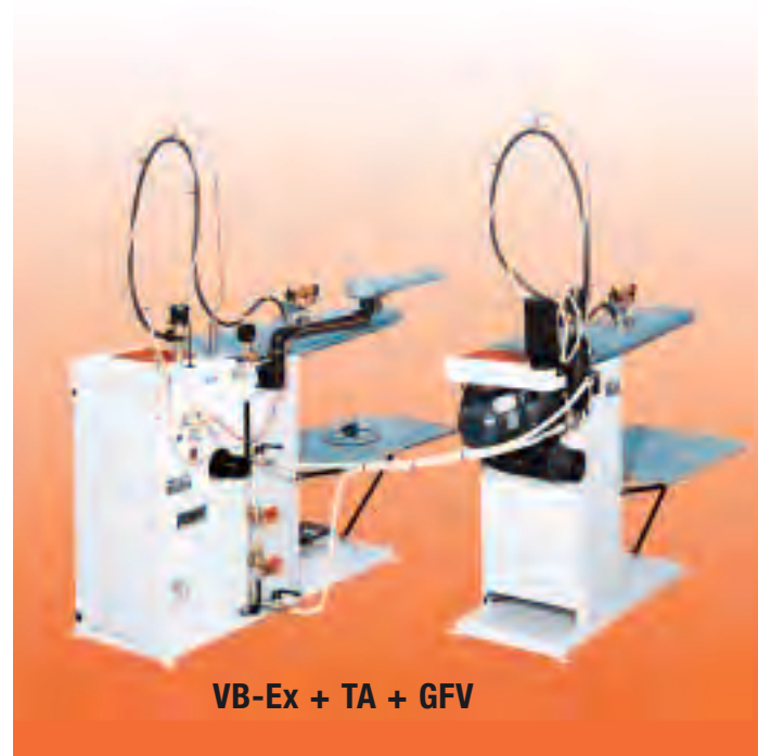
VB-Ex + TA + GFV

Zweiter Dampfbügeleisen, Bügelarm mit Ärmelbügelform und Detachierform, Dampfdetachierpistole oder Dampf-Luftdetachierpistole – Kaltdetachierpistole - Wassersprühpistole auf Bügelisengriff oder mit Haltearm.