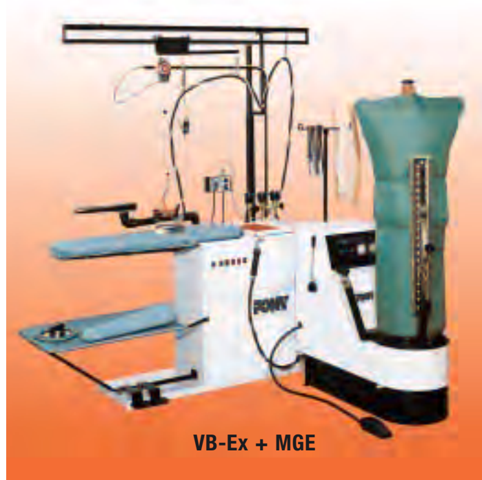
VB-Ex + MGE

Segunda plancha de mano – Brazo con forma planchamangas o con forma de desmanchado – Pistola de vapor o de aire/vapor – Pistola de desmanchar en frío – Nebulizador sobre la empuñadura de la plancha o suspendido.