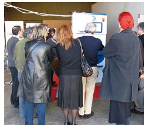
Un total de 60 profesionales del sector de la lavandería-fintorería pudieron conocer los nuevos sistemas de lavado en medio acuoso y en medio disolvente