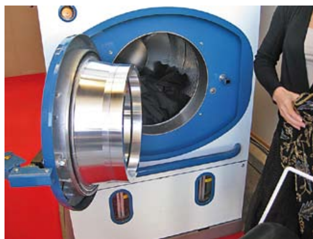
En limpieza en seco se realizaron demostraciones con el sistema Natura Em Technology/Nova de UNION