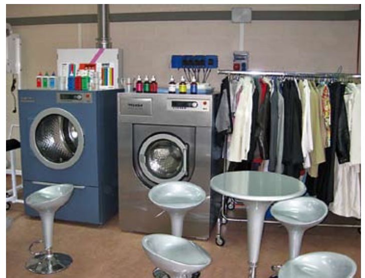
En Wet Cleaning se mostraron las ventajas del sistema Miele/Kreussler