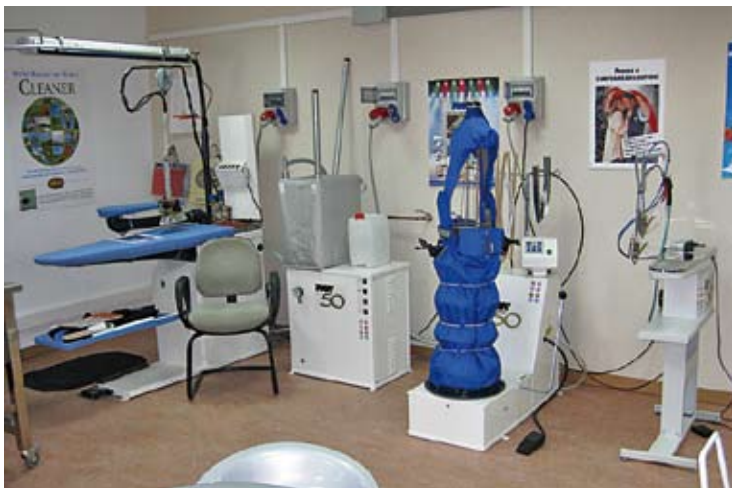
Maquinaria de planchado Pony, firma representada por Distribuciones Seymo